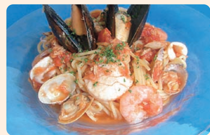
夏季限定メニュー「冷やしパスタ」¥1,380