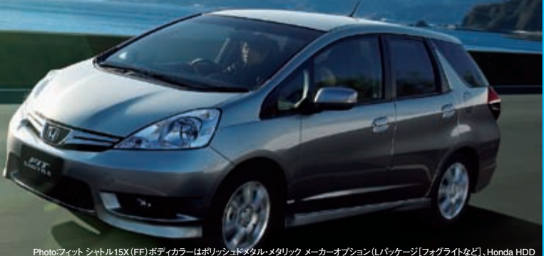
Photo:フィット シャトル15X(FF)ボディカラーはポリッシュメタルメタリック メーカーオプション(パッケージ)フォグライトなど、Honda HDD インターナビシステム+ETC車載器、前席用・サイドエアバッグシステム+サイドカーテンエアバッグシステム+セットで613,300円高)装着車 ※別途、洗車用の「ETCカード」が必要となります。 ※ETC車載器を使用するには「セットアップ」作業が必要となります。(別途セットアップ費用が必要です) ※ETCレーン内では開閉バーや前席の急停車に十分注意し、いつでも停車できる安全な速度(時速20km以下)で通行してください。 ※安全のため走行中の操作はしないでください。必ず安全な場所に停車してから操作・確認を行ってください。

※価格はHonda Cars 東京の一例です。販売価格は販売会社が独自に決めております。詳しくはお近くの販売店にお問い合わせください。価格は全て消費税込みの価格です。消費税を除くその他の税金、保険料、登録等に付する諸費用、リサイクル料金は別途申し受けます。 ■付属品は含まれておりませんので、別途お買い求めください。 ■車両本体価格は、応急パンク修理キット・ジャッキ・標準工具一式付の価格です。 ■車両本体のみご購入いただけます。 ■写真は印刷のため、実際の色とは異なる場合がございます。 ■エコカー減税は、同一車種でもタイプ・駆動方式・メーカーオプションによって、軽減される割合が異なり、適用されない場合があります。