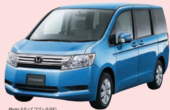
Photo:ステップワゴン G(FP) 車両本体価格の一例 2,088,000円(消費税別)* ボディカラーはアオンブルー-メタリック

Hondaのホームページの[Honda]ユーザーズページには、愛車と撮った写真を投稿できるコーナーがあり、みごとベストショット賞を受賞するとうれしいプレゼントが、おでかけの思い出に撮った一枚で、あなたもプレゼントがもらえるかも!?