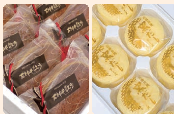
「石神井散歩」1個¥168/10個箱入り¥1,785 「窯出しチーズ」1個¥111/10個箱入り¥1,215